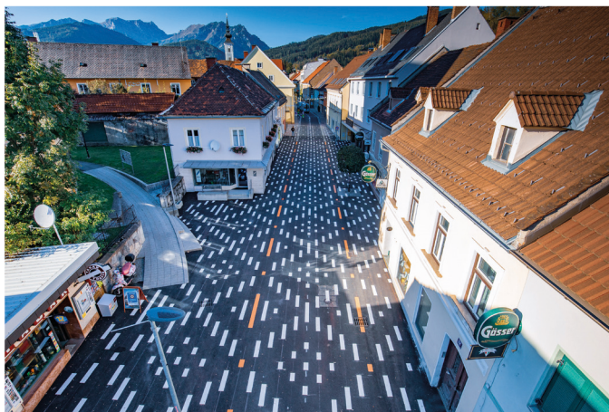
Neu gestaltete Begegnungszone in der Trofaiacher Innenstadt